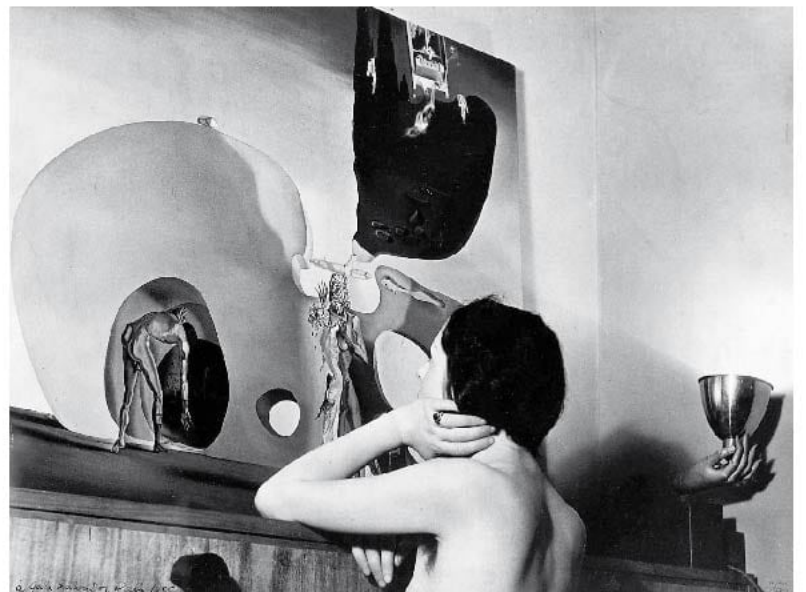
Man Ray, Gala Dalí e os desejos líquidos, fotografia, 1935.