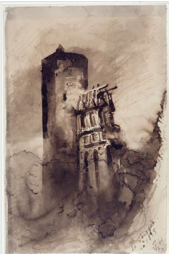
Victor Hugo, La tourque, nanquim, 1835.